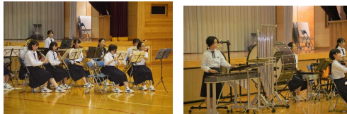
激励会での演奏から

・7月7日(日)由利本荘市カダレで行われたコンクール。本校吹奏楽部の演奏曲は「神々の運命」。銅賞をいただきました。心を込めた素敵演奏に感動しました。