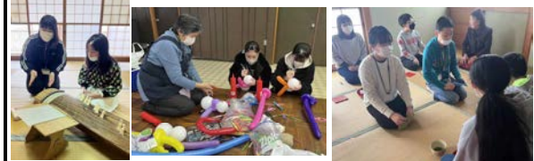
・お琴コーナー ・バルーンアートコーナー ・茶道コーナー

茶道と琴は、中学校で地域の先生から学ぶ機会がありましたので、その体験を生かし、今度は小学生に教えることができました。優しく声を掛ける中学生がいたことで、小学生も安心して体験活動ができたようです。笑顔がいっぱいの一日になりました。