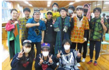
--民族衣装を試着して記念撮影--